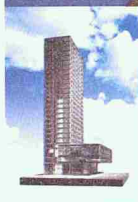
➔ Messeturm Basel