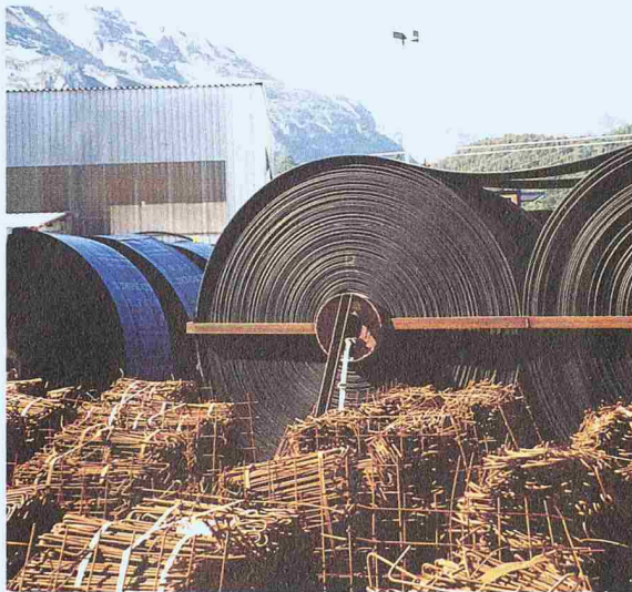
Das Baumaterial- und Ersatzteillager bei der Baustelle Mitholz lässt den Umfang der Bauarbeiten erahnen.

Lötschbergachse hervorzuheben. Hier haben die Verantwortlichen der BLS Alp Transit beste Informationspolitik und nachahmenswerte Öffentlichkeitsarbeit geleistet. An der FGU-Fachtagung war die ausgezeichnete Zusammenarbeit zwischen den beiden Bauherren BLS Alp Transit und der Alp Transit Gotthard AG förmlich zu spüren. Der gegenseitige, wöchentliche Informationsaustausch und Problembesprechungen sind fast schon ein Novum im (leider) noch stark föderativ denkenden Schweizer Bauwesen. Der Austausch von Erfahrungen bei Planung und Bau von grossen Untertagbauprojekten entspricht einem grossen Bedürfnis. Deshalb sind periodische Zusammenkünfte nicht nur notwendig, sondern auch sehr beliebt. Es ist nicht zuletzt der FGU des SIA zu verdanken, dass der Weltverband der Tunnelbauer, die International Tunneling Association (ITA), dieses Jahr ihren Sitz in die Schweiz verlegt hat.