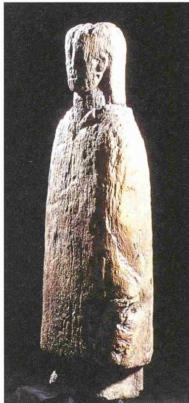
Gallorömische Holzfigur aus Untereschenz aus dem 1. Jh. n. Chr.

Die 61,5 Zentimeter hohe, aus Eichenholz gefertigte männliche Figur mit schulterlangem Haar trägt einen langen Kapuzenmantel. Der Umhang ist typisch für die keltische Kleidertradition. Die Gesichtszüge sind etwas verwitert. Die Holzfigur lag auf dem Bauch in einem Abwasserkanal. Da die Statue aus Holz geschnitzt ist, wäre eigentlich eine direkte dendrochronologische Datierung möglich. Aus restauratorischen Gründen will man dieses aussergewöhnliche Stück jedoch nicht anbohren. Neben der Figur fand man auch einige Keramikscherben aus der ersten Hälfte des 1. Jahrhunderts n. Chr. Diese Statue