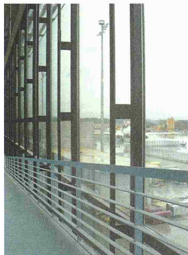
Glasfassade Dock Midfield, Flughafen Zürich-Kloten

Geocom Informatik AG 3400 Burgdorf 034 428 30 30, Fax 034 428 30 32 www.geocom.ch