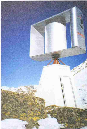
Windenergieanlage mit Vertikalrotor

Solarbau Lowel GmbH 8213 Neunkirch 052 672 55 52 www.ropatec.com