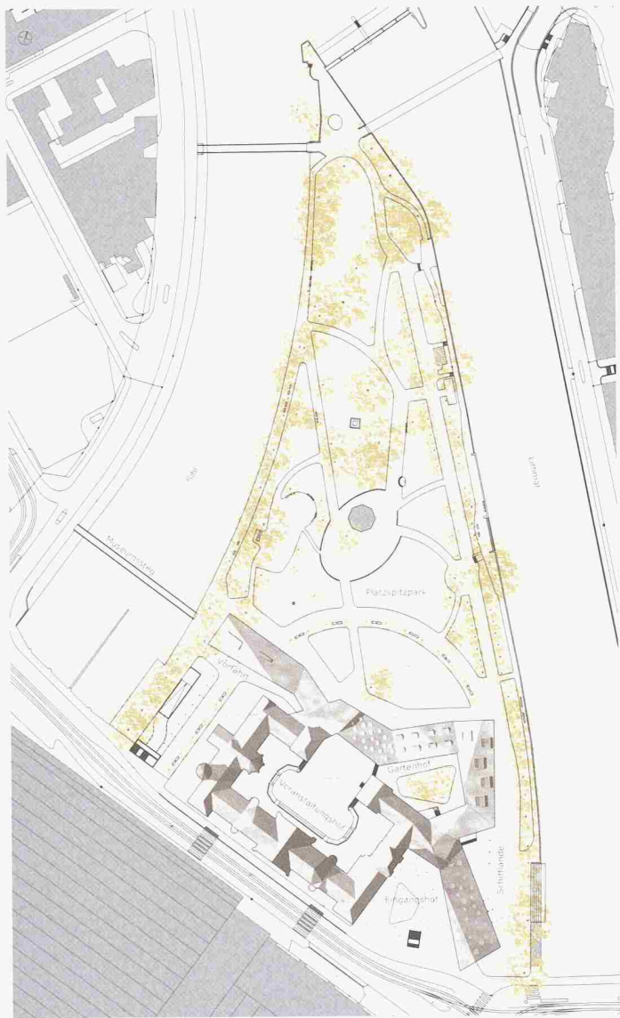
Erweiterung Schweizerisches Landesmuseum in Zürich: Siegerprojekt von Christ und Gantenbein aus Basel. Obergeschoss und Erdgeschoss (links oben), Schnitt (unten) und Situation zwischen Hauptbahnhof und Platzspitz (oben) (Bilder: Christ und Gantenbein)