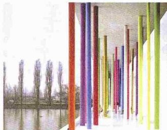
Bild: Expo.02 / Martin & Elisabeth Boesch, Zürich; Aggregat, Szenische Gestaltung, Zürich

(pd/rw) «Oui!» bietet die Möglichkeit, zu zweit einen bewussten Augenblick der Verbundenheit zu teilen und sich für 24 Stunden symbolisch zu verbinden. Der Pavillon passt zum Thema der Arteplage Yverdon «Ich und das Universum» – was hält schon die Welt zusammen wenn nicht die Liebe! Der Pavillon befindet sich auf einem Steg, der auf den Neuenburgersee hinausführt: eine wunderschöne Lage mit Aussicht auf See und Landschaft. Der architektonisch schlicht gehaltene, längliche Pavillon wird von einem farbigen Stützenwald begleitet, der als Blickfang und allen zugängliche Wandelhalle dient und teilweisen Einblick ins Heiligtum gewährt. Nach dem Anstehen beginnt das Ritual mit der Registrierung der Namen. Ein kurzer Aufenthalt in einem inszenierten Warteraum leitet den Gang durch den Pavillon ein, welchen das Paar ungestört zu zweit antritt: Es durchschreitet eine Folge von szenischen Räumen, in denen alle Gestaltungsmittel darauf zielen, die Emotionen auf die eigene Person und den Partner zu lenken. Die Reise gipfelt im letzten Raum, wo die eigentliche Verbindung stattfindet: In diesem intimen Moment wird ein tragbares Souvenir an das gemeinsame Erlebnis ausgetauscht. Darauf wird das Paar entlassen und wandelt durch den bunten Stützenwald zurück in die Realität.