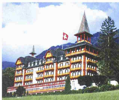
Das Hotel «Paxmontana» in Flüeli-Ranft wird seit drei Jahren schrittweise saniert. Das 1896 erbaute und 1906 erweiterte Jugendstil-Hotel weist reich dekorierte Gesellschaftsräume im Stil der Belle Epoque auf. Führungen: 8.9., 14, 15 und 16 h

(pd/aa) Ob traditionelle Handwerksmethoden oder computergestützte Analysen – bei der Erhaltung unserer Denkmäler begegnen sich Handwerk und Hightech. Aus Anlass des Europäischen Tags des Denkmals am 7. und 8.9. werden gegen zweihundert verschiedene Denkmäler, Ateliers und Werkstätten offen stehen. Dabei können Berufsleute, die sich mit unseren Kulturgütern befassen, bei ihrer Arbeit beobachtet werden. Das Programm beinhaltet auch zahlreiche geführte Besichtigungen in Denkmälern, die der Öffentlichkeit normalerweise nicht zugänglich sind. Das Programm ist kostenlos erhältlich bei Nike, Nationale Informationsstelle für Kulturgüter-Erhaltung, Tel. 031 336 71 11 und ist abrufbar unter www.hereinspaziert.ch .