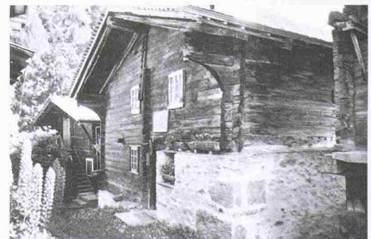
Der Kern des Gommer Dorfes Mühlebach besteht heute aus einer Reihe von so genannten «Heidehischer», das heisst aus Häusern mit einem Ständer oder Heidenkreuz in der Giebelwand unter dem Dachfirst. Diese Bauten werden gemeinhin als sehr alt angesehen, die architekturgeschichtliche Forschung hat sie in die Zeit um 1500 datiert. Führungen: 7.+8.9., 10 und 14 h, Treffpunkt Platz an der Ostseite des Dorfes