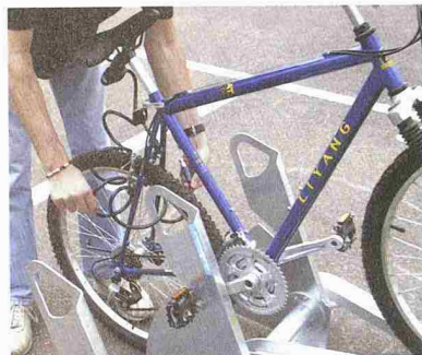
Das neue Veloparkier-System Pedal-Parc von Velopa AG

Stierli Bieger AG 6210 Sursee 041 920 20 55, Fax 041 920 24 55 www.stierli-bieger.com