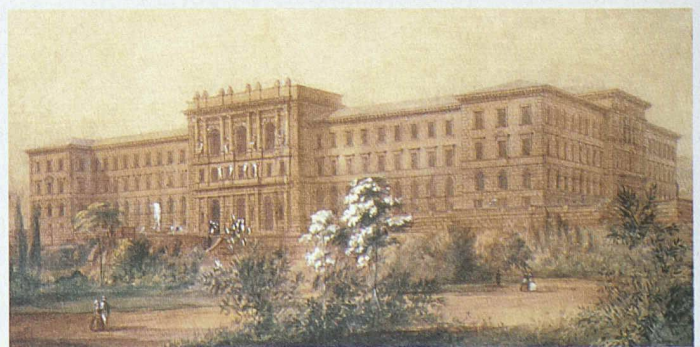
Gottfried Semper, Polytechnikum in Zürich, Perspektive von Südwesten, um 1859

Kaiserforum in Wien. Zur Ausstellung wird ein umfangreiches Begleitprogramm angeboten, das Führungen vor Ort, Vorträge und moderierte Gespräche beinhaltet. Die Ausstellung im Museum für Gestaltung in Zürich wird gezeigt vom 1. November 2003 bis 25. Januar 2004, geöffnet ist jeweils Di–Do von 10–20 h und Fr–So von 11–18 h. Weitere Infos und Details zum Begleitprogramm unter: www.museum-gestaltung.ch oder 01 446 22 11. Die kommende Ausgabe von tec21 befasst sich ausführlich mit Sempers Schaffen (Vorschau siehe Seite 37).