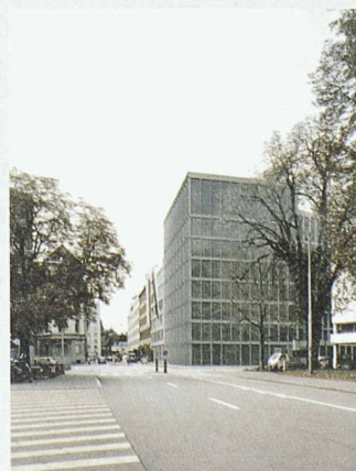
Wettbewerb Picasso-Center, Basel: Siegerprojekt «Baal» von Peter Märkli, Zürich (Bild: Peter Märkli)

Die Wettbewerbsbeiträge sind bis am 15. Februar im Architekturforum Zürich zu sehen. Am 5. Februar um 18.30 Uhr findet eine Führung mit Vertretern der Teilnehmerteams statt.