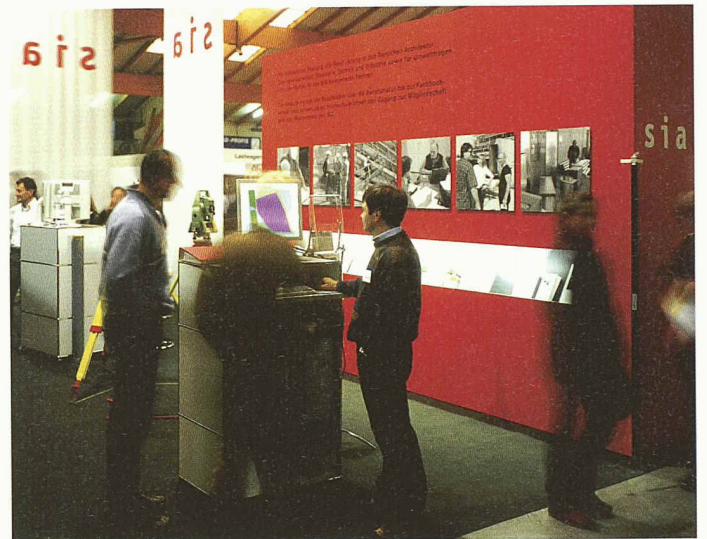
Der vom SIA gemeinsam mit den Lehrmeisterverbänden und Berufsschulen gestaltete Stand an der Bildungsmesse in Luzern vermittelte den Ratsuchenden einen guten Einblick in die Arbeit der Planerberufe

An dieser Präsidentenkonferenz wurde das Thema Berufsgesetz und Berufszulassung in drei Arbeitsgruppen aufgrund eines entsprechenden Fragenrasters diskutiert. Es zeigte sich, dass die Anerkennung von Diplomen eigentlich kaum als problematisch betrachtet wird. Hingegen sind nach Meinung der Arbeitsgruppen für die Berufe der Architekten und Ingenieure insbesondere bei der Zulassung zum Markt deutlich verbesserte Regelungen angezeigt. Zudem müssten die Berufsstände, welche unter ein Architekten- und Ingenieurgesetz fallen, entsprechend definiert werden. Unter den Begriff Ingenieur fallen zahlreiche und unterschiedliche Fachrichtungen. Der Beruf des Bauingenieurs ist dabei