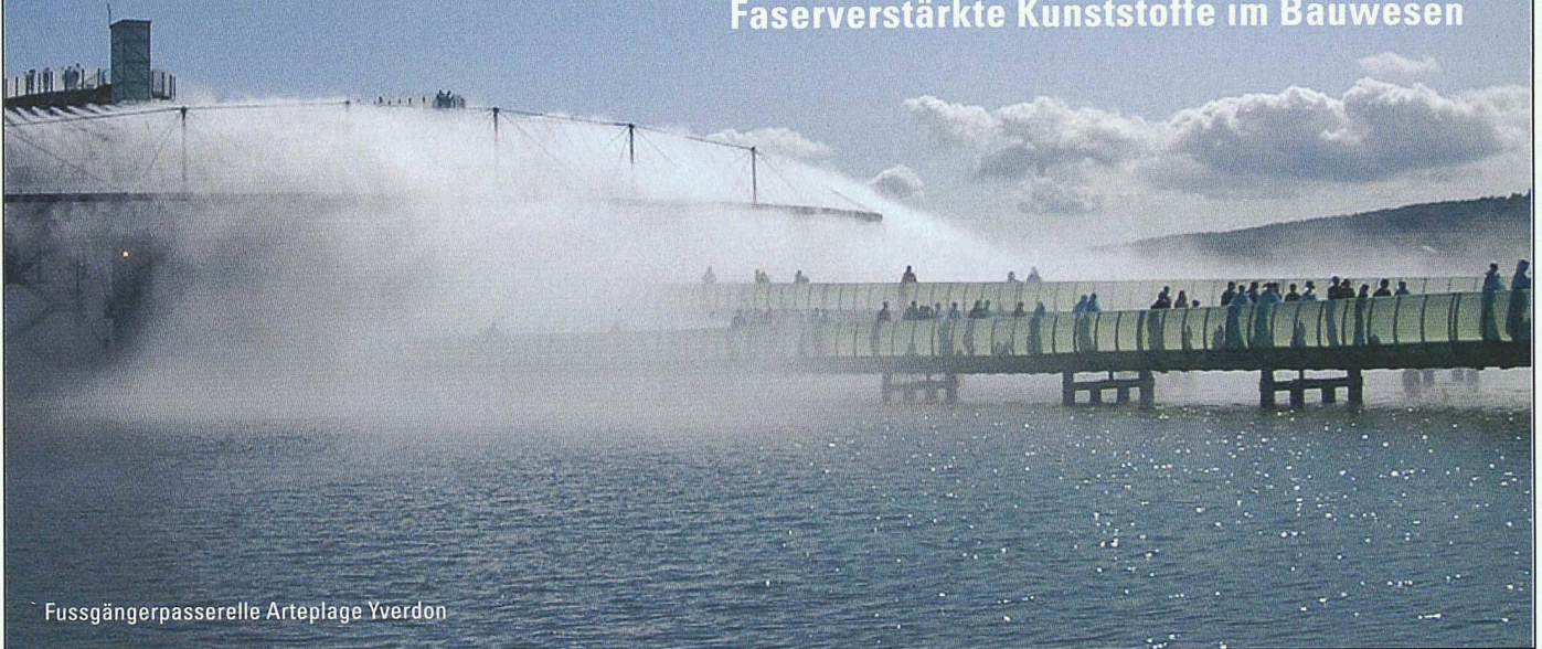
Fussgängerpasserelle Artepilage Yverdon

Beläge | Passerellen | Fassaden | Möbel | Profile