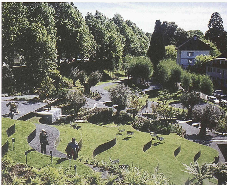
Barock anmutendes Parkett aus unterschiedlichen Buchsbaumarten im Garten der Swiss Re in Rüschlikon von Vogt Landschaftsarchitekten