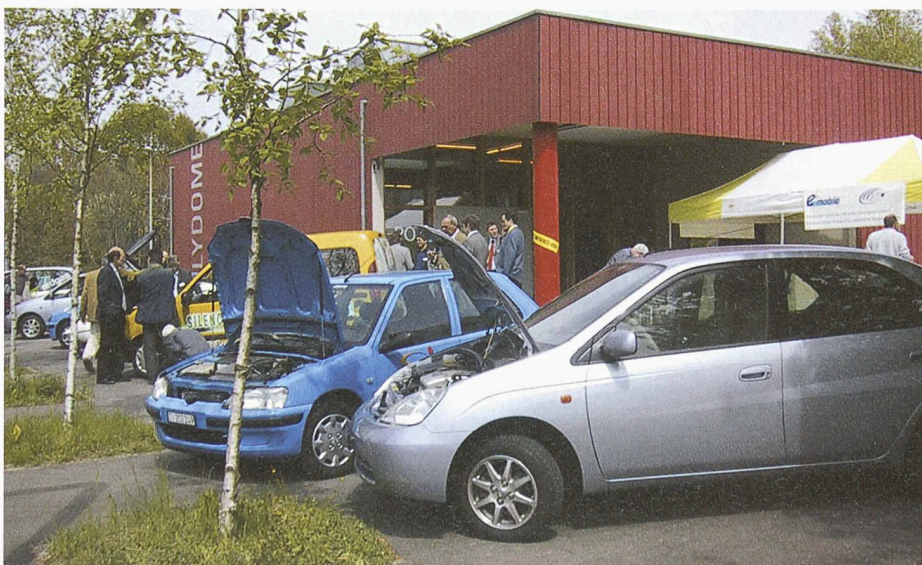
An Informationsveranstaltungen bietet e'mobile Gelegenheit, Hybrid-, Elektro- und Erdgasfahrzeuge Probe zu fahren.

c/o InfoVEL Mendrisio, Via Angelo Maspoli 15, 6850 Mendrisio, Tel. 091 646 06 06, Fax 091 646 05 35, infoticino@e-mobile.ch