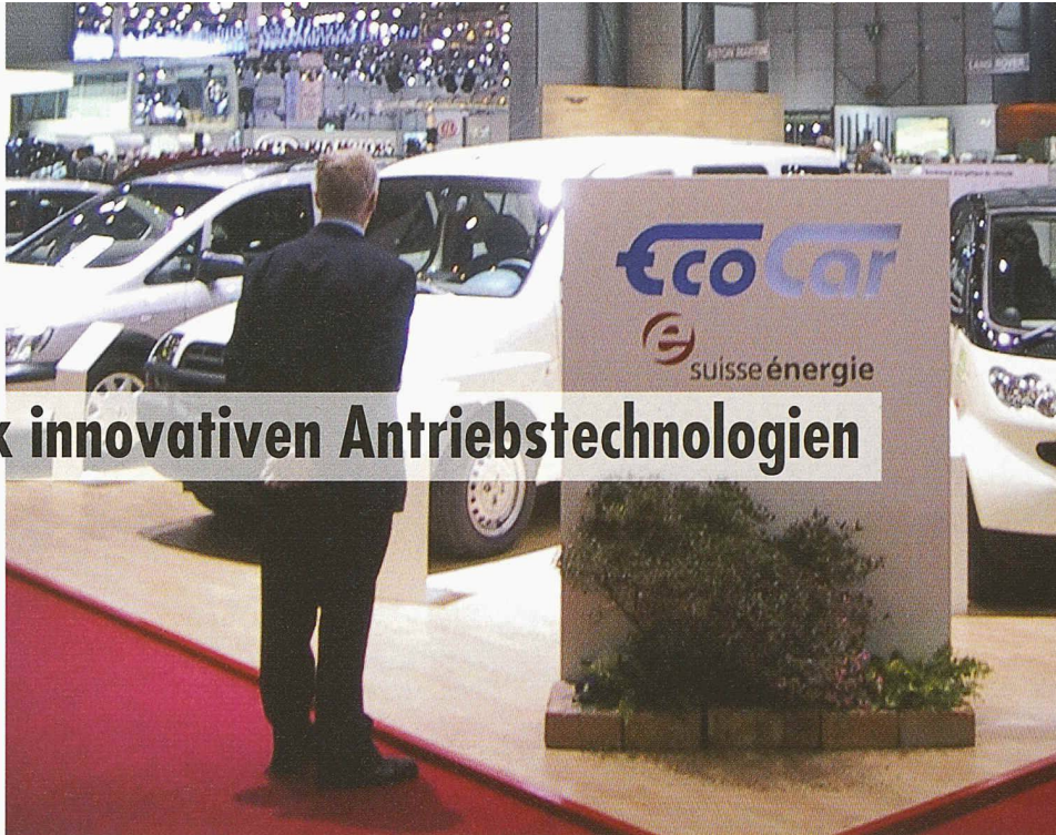
Der EcoCar-Stand am Autosalon in Genf bildet einen Schwerpunkt im Jahresprogramm des Verbands e'mobile.

Vor allem für Fahrzeuge mit alternativen Antriebssystemen erweist sich das persönliche Fahrerlebnis als zentrales Element im Kaufprozess. In Zusammenarbeit mit den Fahrzeugherstellern bie-