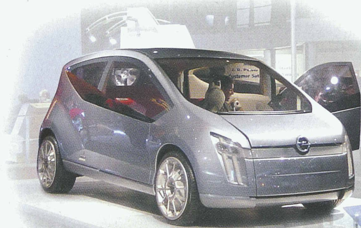
FILO concept car by SKF-Bertone Vorgestellt am Autosalon in Genf März 2001