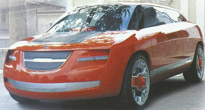
Novanta concept car by SKF-Bertone Vorgestellt am Autosalon in Genf März 2002