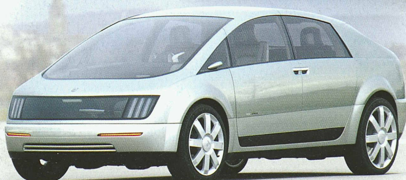
General Motors Fuel-cell-powered Hy-wire Vorgestellt an der Paris Auto Show September 2002

Die By-Wire-Technik von SKF hat wesentlich zum Erfolg mehrerer hochinnovativer Konzeptfahrzeuge beigetragen. SKF forscht und entwickelt in diesem Bereich seit über 15 Jahren und ist ein führender Anbieter von Drive-by-Wire-Lösungen, darunter von intelligenten Steuerungen für Lenk-, Brems-, Kupplungs- und Beschleunigungssystemen. Die intelligenten elektromechanischen SEMAU-Aktuatoren (Smart Electro-Mechanical Actuating Units) von SKF bieten Konstrukteuren völlig neue Möglichkeiten bei der Fahrzeugentwicklung.