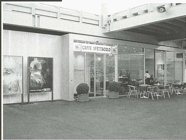
Caffe Spettacolo HB Zürich (Architekt: Pool Architekten Zürich)

Scheifele Container AG • Vorfabrizierte Bauten Unterdorfstrasse 21 • 8114 Dänikon Tel. 01 844 34 40 • Fax 01 844 34 74 container@scheifele.com • www.scheifele.com