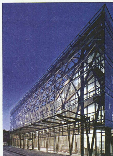
Neubau der Landesvertretung Nordrhein-Westfalen beim Bund in Berlin; Architektur: Petzinka Pink Architekten, Düsseldorf

Zusammenarbeit haben zu zukunftsweisenden Baulösungen geführt, die an der Tagung anhand besonderer Beispiele vorgestellt werden. Die präsentierten Objekte zeichnen sich aus durch den konsequenten Einsatz leichter Materialien, die Flexibilität der Nutzflächen, ihre effizienten Energiekonzepte und durch eine offene, transparente Gestaltung. Die Tagung findet am 27. März (14.30–18.15 h) an der ETH Zürich im Hauptgebäude statt. Anmeldungen bis 14. März per Fax an 01 825 09 08 oder im Internet unter www.szs.ch (News/Veranstaltungskalender). Weitere Infos: Stahlbau-Zentrum Schweiz, Tel. 01 261 89 80.