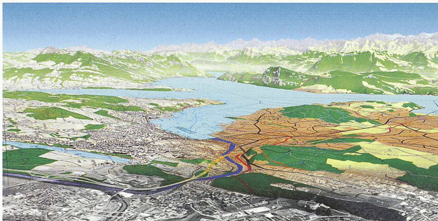
Digitales Landschaftsmodell der Stadt Luzern mit dem Vierwaldstättersee, berechnet mit Geodaten