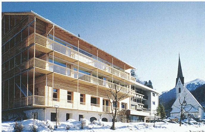
Bauzeit 4 Wochen: Anbau am Hotel Krone in Au/Bregenzerwald mit 20 Betten und einem Seminarraum. In der Zimmerei komplett vorgefertigte Zimmerzellen wurden auf das vorher erstellte Sockelgeschoss gestapelt und montiert