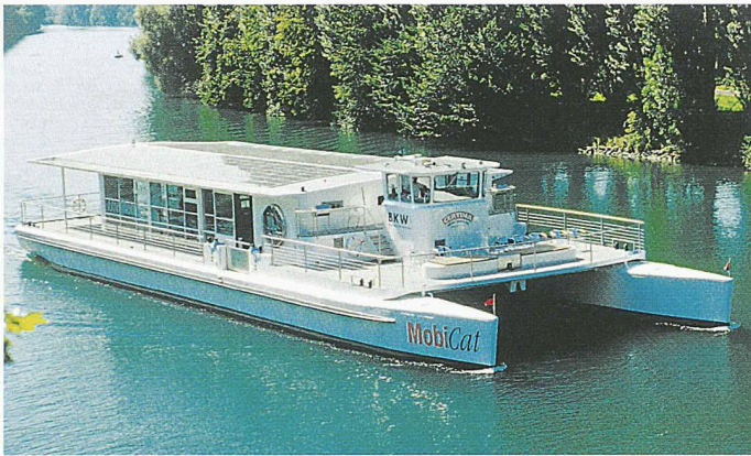
Solar-Katamaran «Mobicat» unterwegs im Drei-Seen-Land