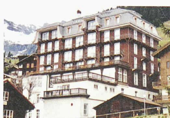
Bauzeugen als Attraktion im Skort Mürren: Hotel «Alpina + Edelweiss», neue Sachlichkeit im Hochgebirge von Arnold Itten, 1927 (ganz oben); Schulhaus Gimmelwald, alpiner Historismus im Ständerbau von 1904 (links); Hotel «Regina», Heimatstil von 1911 (rechts)