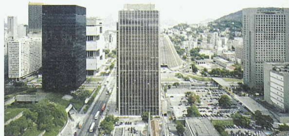
Bild von Tobias Madörin, Centro do Rio de Janeiro, 2002 (Ausschnitt)

seine Bilder dokumentieren die widersprüchlichen Lebensbedingungen in den Megacities: Fussballstadien, öffentliche Schwimmbäder oder das Sambadromo und gleichzeitig Favelas, Müllberge oder einen Friedhof für ausgediente Bohrtürme. Die Ausstellung dauert vom 27.2.–19.4. und ist jeweils geöffnet Di–Fr 12.15–18.15 h und Sa 11–16 h. Weitere Infos: www.architekturforum-zuerich.ch oder Tel. 01 252 92 95.