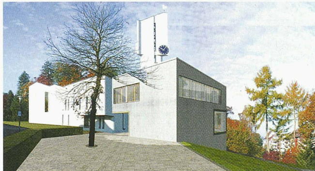
Das Siegerprojekt der Arbeitsgemeinschaft Flury und Kopp, Weinfelden, Blatter und Müller, Erlen; sowie Kuhn und Truninger, Zürich (Blick von der Bahnhofstrasse)

(pd) Die evangelische Kirchgemeinde Bischofszell-Hauptwil und die Stadt Bischofszell haben gemeinsam einen Projektwettbewerb für die Erstellung eines Kirchgemeindehauses mit Parkgestaltung durchgeführt. Insgesamt elf Teams wurden zum Wettbewerb eingeladen. Das Preisgericht legte folgende Rangfolge fest und empfiehlt das erstrangierte Projekt zur Weiterbearbeitung.