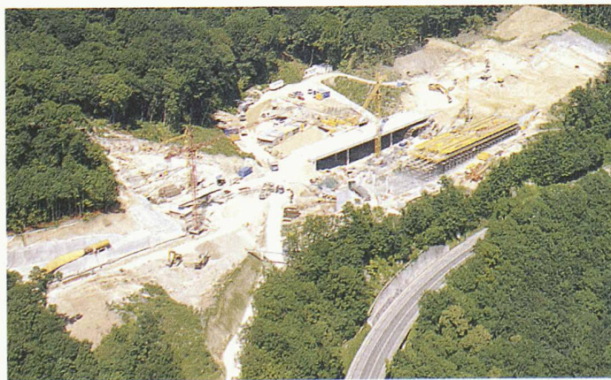
Bauen bedingt stets einen Eingriff in die Landschaft. Um möglichst schonungsvoll vorzugehen, braucht es den Beitrag aller Beteiligten

Auf der Baustelle La Poissine werden die Revitalisierung des Arnon, die Fischzucht von La Poissine, die Wildbrücken in Champagne und Prélonchamps sowie die ökologische Vernetzung gezeigt. In Onnens stehen die mit dem Bau des überdeckten Abschnittes verbundenen hydrogeologischen Probleme und die Landschaftsgestaltung im Vordergrund. Der Teilnutzungsplan, die Wildbrücken und die Revitalisierung der Uferzone in La Rochelle sind Gegenstand der Führungen von La Raisse. Zur Synthese des Tages und zum Apéro treffen sich die Gruppen in der Domaine de la Charreuse de la Lance. Anschliessend Abendessen im Gemeindegasthaus von Onnens. Auskünfte und Anmeldung bei der SIA Sektion Waadt, Sekretariat, Françoise Oberson, Av. Jomini 8, 1004 Lausanne, Tel. 021 646 34 21, Fax 021 647 19 24, E-Mail info@siavd.ch