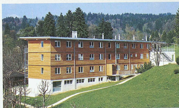
Am 6. Mai veranstaltet die Schweizerische Hochschule für die Holzhausbau ein Seminar zum Thema Qualität im Holzhausbau. Im Bild: Wohnhaus Bois-Gentil, La Chaux-de-Fonds; Architektur: Charles-Eric Chabloz, Antoine Chabloz, La Chaux-de-Fonds; Holzhausbau: Häring & Co., Pratteln

Begleitet wird die Tagung durch eine Ausstellung. Informationen und Anmeldung: Claudia Stucki, Schweiz. Hochschule für die Holzwirtschaft, Tel. 032 344 03 18, Mail: sic@swood.bfh.ch oder www.swood.bfh.ch.