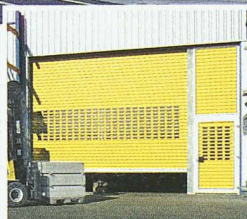
Hörmann Rolltore, jetzt auch als «Speed» Version