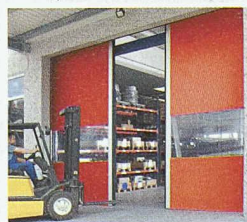
Schnellaufitore mit flexiblem Behang