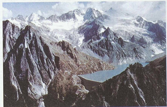
Das Nachdiplomstudium widmet sich dem gesamten Lebenszyklus von hydraulischen Mehrzweckanlagen (Planung, Bau, Unterhalt, Betrieb), wobei besonderes Gewicht auf die Wasserkraftnutzung und den Hochwasserschutz gelegt wird. Das Studium wird in Englisch und Französisch unterrichtet. Oben: Staumauer des Albigna-Stausees bei Vicosoprano, Bergell

zeln besucht werden): Management und Technik von Wasserressourcen; Gesamtheitlicher Entwurf und Umweltverträglichkeit von hydraulischen Anlagen; Dimensionierung und Ausführung von hydraulischen Anlagen und Talsperren; Wasserkraftanlagen; Flussbau und Hochwasserschutz; Siedlungswasserbau, Wasserversorgung, Entwässerung und Kanalisation; Wirtschaftlichkeit, Planung und Leitung von Projekten; Revitalisierung von Gewässern und Ingenieurbaukunde. Anmeldung (bis Mitte Mai 2003) und weitere Informationen: ENAC-EPFL, Lausanne, 021 693 63 24 / 25 17, Fax 021 693 22 64, E-Mail: postgrade.lch@epfl.ch; Internet: http://lchwww.epfl.ch/postgrade .