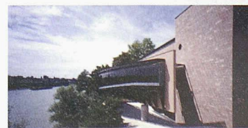
Museum Jean Tinguely, Basel, von Mario Botta, 1996 eröffnet. Oben: Westfassade mit Brunnen von Christian Baur Unten: Südfassade mit «Barca» von Pino Musi