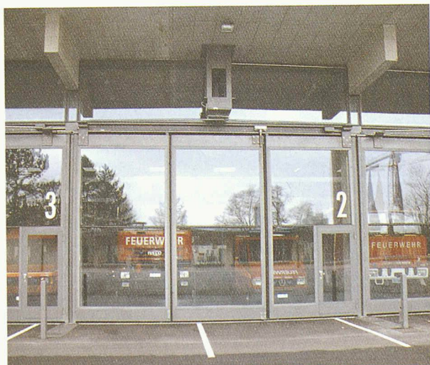
grösste verglaste Faltdortflügel Europas

Darf es auch einmal ein schönes Tor sein ?