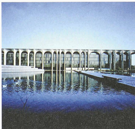
Die rhythmisierte Stützenabfolge charakterisiert die Fassade des Verlagshauses Mondadori in Mailand

Die Ausstellung im Deutschen Architekturmuseum läuft noch bis am 11. Mai 2003. Die begleitende Publikation kostet EUR 29.50.