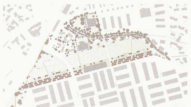
Im Süden die Promenade, in der Mitte die Wiese, im Norden der Naturraum um die Eulach (2. Rang, Heipl & Staubach)