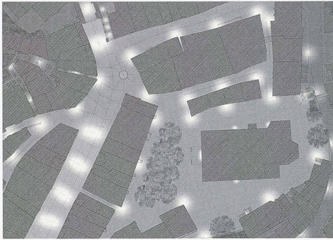
Links die Weite Gasse mit dem Löwenplatz (1. Rang, Mosersidler, Eppler Maraini Schoop, Appert + Zwahlen)