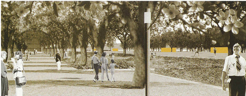
Die Promenade als Rückgrat des Parks (2. Rang, Heipl & Staubach)