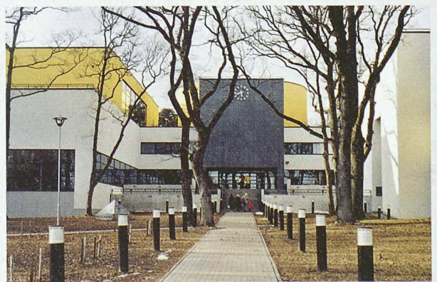
Die Schule Rocca al Mare in Tallinn, der Hauptstadt Estlands, wird ebenfalls besichtigt. Architekten: Urbel, Peil, Mähar, Erm, Baujahr 2000 (Bild: D. Marti)

Museen und Schulen, historische Stadtteile, neu genutzte und gestaltete öffentliche Flächen und Aussenräume. Thema ist aber auch das «wilde» Bauen, wo sich die Frage nach einem Richtplan stellt. Auf dem Programm stehen u. a. die Stadt Liepaja, Lettland, einst Kriegshafen der Sowjets, bestehend aus einem zivilen und einem militärischen Stadtteil, Jurmala, Bauplatz der wohlhabenden lettischen Mittelschicht, oder Pärnu, ein estnischer Sommerkurort, sowie das Bernstein-Museum in Vilnius, Litauen. Detailliertes Programm und Anmeldung (bis 6.6.): Dominic Marti, doma@freesurf.ch, Tel. 031 951 76 20.