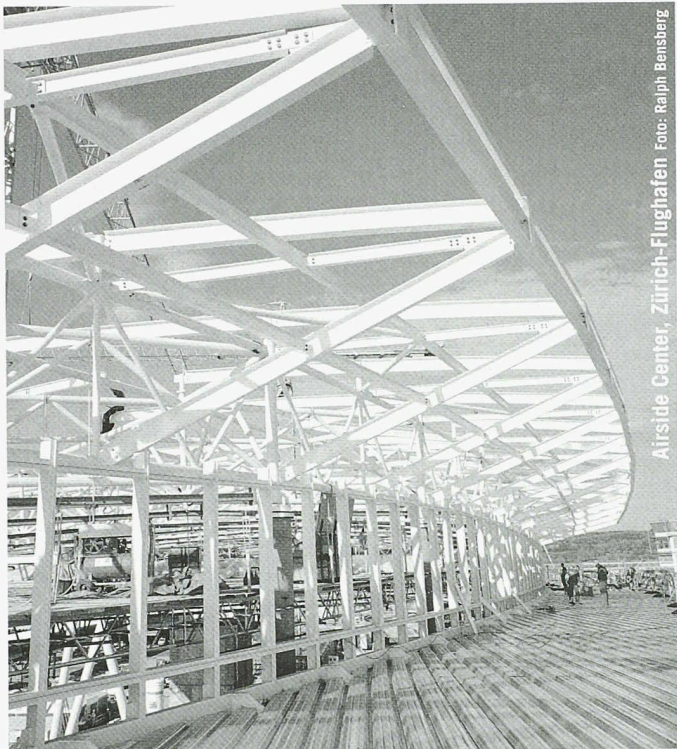
Airside Center, Zürich-Flughafen

Partner für anspruchsvolle Projekte in Stahl und Glas