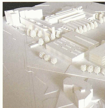
Modell für einen Architekturwettbewerb. Die mit der Beurteilung der Projekte betrauten Jurymitglieder müssen von allen Wettbewerbsteilnehmern unabhängig sein. Darin, wie dies erreicht werden soll, widersprechen sich allerdings die SIA-Wettbewerbsordnung und das öffentliche Beschaffungsrecht

Dies allerdings zieht erhebliche praktische Schwierigkeiten nach sich, wenn es an die Bestellung eines Preisgerichtes geht. Denn die Fachleute, die dort Einsitz zu nehmen haben, sind per definitionem im gleichen Bereich tätig wie die Teilnehmer. Dazu kommt, dass