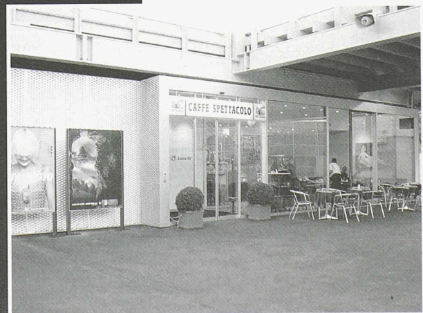
Caffe Spettacolo HB Zürich (Architekt: Pool Architekten Zürich)

Scheifele Container AG • Vorfabrizierte Bauten Unterdorfstrasse 21 • 8114 Dänikon Tel. 01 844 34 40 • Fax 01 844 34 74 container@scheifele.com • www.scheifele.com ISO 9001:2000 zertifiziert