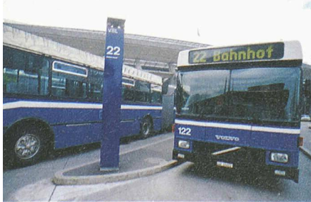
Öffentlicher Verkehr in Luzern