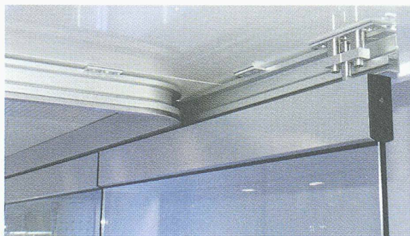
Der durchdachte Parkraum eröffnet neue Gestaltungsmöglichkeiten.

Lassen Sie sich ausführliche Unterlagen schicken.