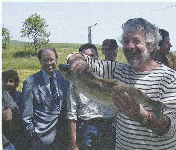
Ein Prachtsexemplar einer Forelle als Beweis für die erfolgreichen Renaturalisierungsmassnahmen am Arnon