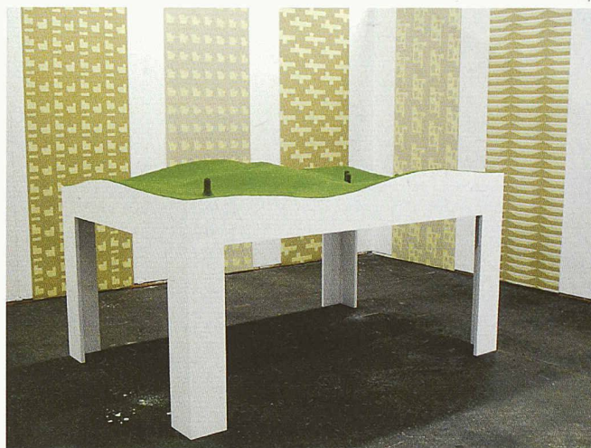
Die Architekturbeiträge sind der Kunst so nahe, dass sie auch Kunst sind. Eine von 4 ausgezeichneten Arbeiten: der «Raum mit Tisch» von Müller Sigrist Architekten

Was Architektur ist, bestimmen die Teilnehmenden selbst, indem sie sich für den Architekturwettbewerb anmelden. Die Altersgrenze liegt bei 40 Jahren. In der ersten Phase bewirbt man sich mit einem Dossier. Teams sind zugelassen. Die Kunstkommission wählt zusammen mit den Architekturexperten nicht Projekte aus, sondern Personen, von denen sie sich einen interessanten Beitrag erhofft. Dieses Jahr bewarben sich 84 Einzelpersonen und Teams im Bereich Architektur, davon wurden 27 für die zweite Runde eingeladen. Bei den nun 4 ausgezeichneten Arbeiten fällt auf, wie unterschiedlich sie sind.