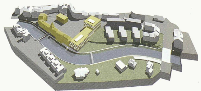
Für den neuen Platz links werden die bestehenden Bauten mit einbezogen (1. Rang, Büro B)