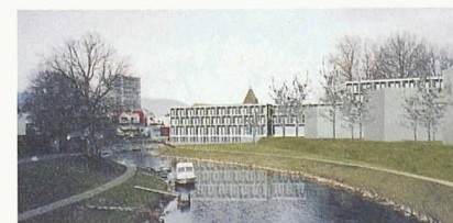
Der Blick von der Thièle, rechts im Vordergrund die Wohnbauten (1. Rang, Büro B)