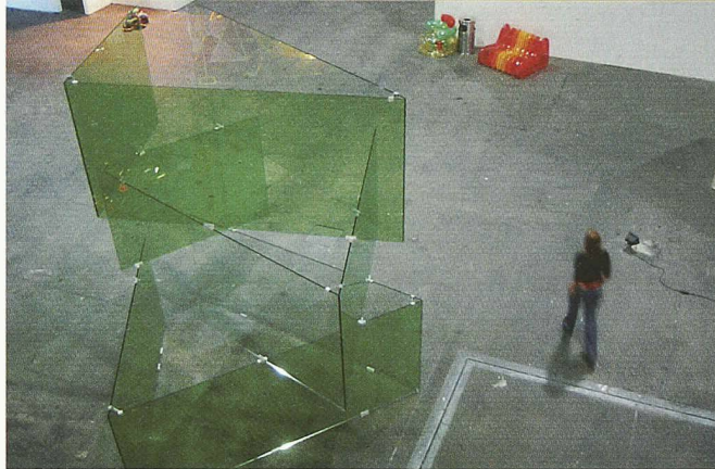
Buchner Bründler Architekten fügen 9 Scheiben zu einem Glasturm zusammen