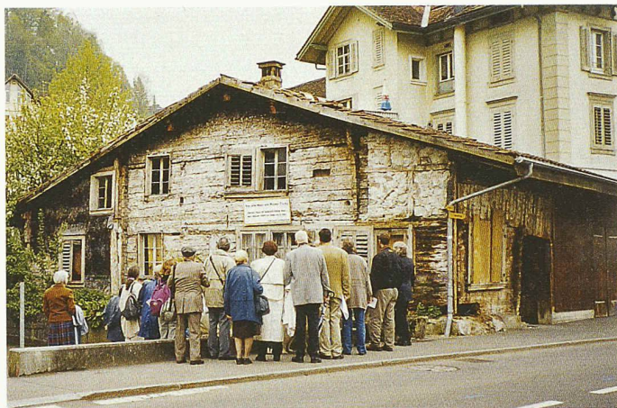
Das Niederöst-Haus in Schwyz aus dem 12. Jahrhundert, ältestes Holzhaus Mitteleuropas, vor dem Abbruch

(pd/mb) Der Bundesrat hat die «Ergänzung Landschaft» zum Richtplan des Kantons Thurgau genehmigt. Die kantonalen Behörden haben somit eine Grundlage, um die Öko-Qualitätsverordnung zu vollziehen und die «Intensivlandwirtschaftszonen» im Sinne des Raumplanungsgesetzes auszuscheiden. Mit der Ergänzung kann der bisherige punktuelle Schutz von Natur- und Landschaftsräumen nun ausgeweitet werden.