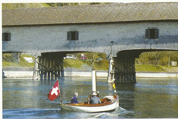
Die gedeckte Holzbrücke über den Rhein zwischen Diessenhofen TG und Gailingen am deutschen Ufer von 1816 ist fertig saniert