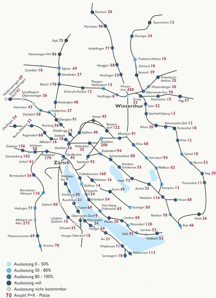
Die Park & Ride-Stationen an Bahnhöfen im Kanton Zürich (ohne Stadt Zürich) mit Parkplatzzahl und Auslastung (Grafik: RZU)