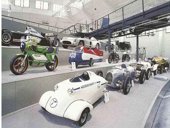
20 000 Exponate auf 20 Kilometern: Das Deutsche Museum in München gilt als Vorreiter der Technikmuseen