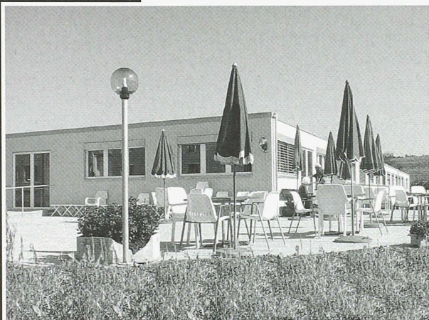
Alterswohnheim Klotten (Architekt: Thomet Bauleitungen)

Scheifele Container AG • Vorfabrizierte Bauten Unterdorfstrasse 21 • 8114 Dänikon Tel. 01 844 34 40 • Fax 01 844 34 74 container@scheifele.com • www.scheifele.com ISO 9001:2000 zertifiziert