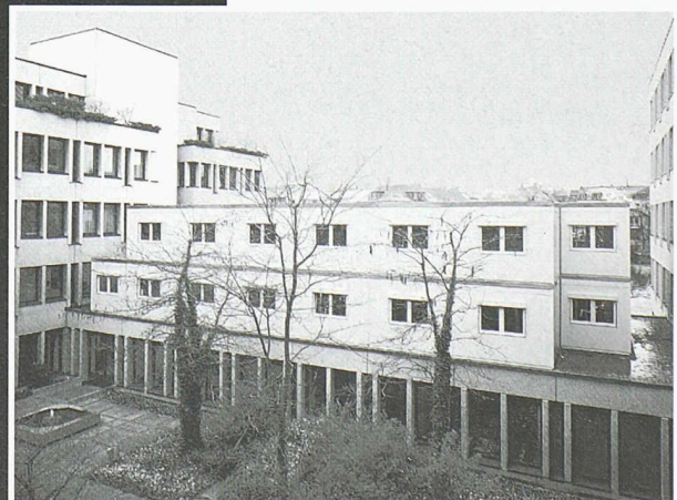
2-geschossiger Aufbau auf bestehendes Flachdach

Scheifele Container AG • Vorfabrizierte Bauten Unterdorfstrasse 21 • 8114 Dänikon Tel. 01 844 34 40 • Fax 01 844 34 74 container@scheifele.com • www.scheifele.com ISO 9001:2000 zertifiziert