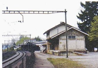
Hier rollten bis Oktober 2002 400 Züge pro Tag vorbei. Das Bahnareal Bützberg wird nun verschwinden, das Bahntrasse der Natur zurückgegeben

Das verfallene Aufnahmegebäude, der Güterschuppen, die Perronanlagen und die Personenunterführung werden ebenfalls abgebrochen. Bis Ende 2003 sollen auch die anderen Bauten, drei Unterführungen und eine Strassenüberführung, verschwinden. Das reaktivierte Bahntrasse wird im Frühjahr 2004 der Gemeinde Thunstetten/Bützberg übergeben. Die Gesamtkosten für den Rückbau aller Objekte belaufen sich auf rund vier Millionen Franken. Die Rückbauarbeiten der Brückenobjekte werden durch das Forschungsprojekt «Zebra» (Zustandserfassung von Brücken bei deren Abbruch), unter der Führung der ETH Zürich, begleitet. Die in diesem Rahmen durchgeführten Untersuchungen und Messungen sollen neue Erkenntnisse über relevante Schädigungs- und Versagensmechanismen von Brücken sowie Erkenntnisse zur Überprüfung ähnlicher Objekte liefern.