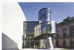
Der gläserne Treppenturm des Deutschen Historischen Museums von Ieoh Ming Pei

Das Historische Museum, das Anfang der 90er-Jahre nach einem siegreichen Wettbewerbsprojekt von Aldo Rossi im Spreebogen hätte errichtet werden sollen, residiert heute im ehemaligen DDR-Museum für deutsche Geschichte im einstigen Zeughaus am Boulevard Unter den Linden. Da der Barockbau von Andreas Schlüter mit der Sammlung ausgelastet ist, wurde der Anbau hinter dem Zeughaus für Wechselausstellungen geplant. Dieser ist unterirdisch mit dem Altbau verbunden. Oberirdisch markiert er seine Präsenz mit dem gläsernen, spindelförmigen, skulptural ausgebildeten, Treppenturm – Blickfang und Verweis auf das ausgedehnte Erschliessungssystem im Innern, das als Entdeckungsreise angelegt ist. Ieoh Ming Pei baute weltweit zahlreiche Museen. Sein bekanntestes ist die Erweiterung des Louvre in Paris (1988–93) und insbesondere dessen Glaspypamide. Sein vom landschaftlichen Kontext her vielleicht Spektakulärstes ist das Miho Museum im gebirgigen Naturreservat der Stadt Shigaraki in Japan.