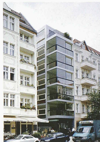
Nägeli Architekten: Wohnhaus in einer typischen Berliner Baulücke

«rein raus» von realities united, ein auf einer Stahlschiene montierter Liegestuhl, der aus dem Fenster gefahren werden kann, bietet sich als spektakulärer Balkonersatz an. Fuchs+Funke unterziehen den Klappstuhl einem Redesign und entwerfen einen «Kombinationsstuhl», einen Lounge chair, der sich in einen Sessel verwandeln lässt. Stiletto montieren innen beleuchtete Punchingbälle, die auf Anschlag reagieren, und Vogt+Weizenegger lassen ihren «Sinterchair» von einer Modellbaumaschine aus Nylonpulver herstellen. Ironie ist ein Merkmal der unter «Konzepte» laufenden Entwürfe. Rafael Horzon etwa schlägt eine Verschalung vor, mit der unliebsame oder missglückte Fassaden «getarnt» werden können. Marion Eichmann «verstrickt» sich in der Entfremdung. In ihrer Arbeit «16.324.800 Maschen» umstrickt sie Wand, Boden, Tisch, Stuhl, Vase, Tasse und sich selber mit einem einheitlichen schwarzweissen Wellenmuster, in dem die einzelnen Gegenstände miteinander verschmelzen. Konkreter mit der Stadt befassen sich realities united und F.r.e.d. Rubin. Ersterer thematisieren den städtebaulichen Aspekt, sie wollen den brach liegenden Flussraum mit einem