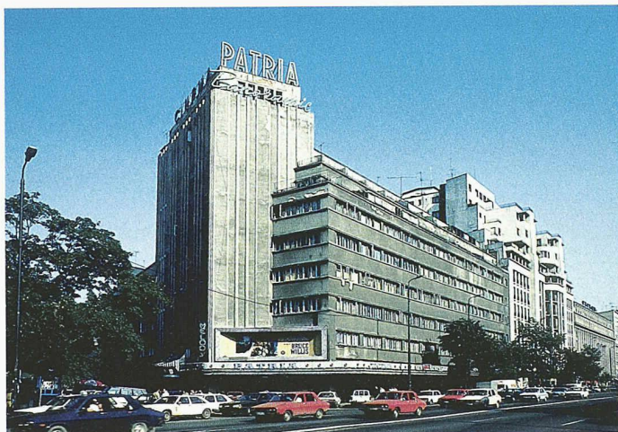
Das Haus Ottulescu (1934–35) von Horia Creanga inszenierte den grossstädtischen Charakter des modernen Bukarest (Bild: Stefan Ghenculescu)