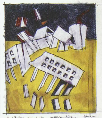
«Architettura Assassinata» von Aldo Rossi

in Modena, aber auch Entwürfe für Rathäuser, Schulen und Wohnbauten werden dokumentiert. Öffnungszeiten: Di–So von 10–17 h, Mi von 10–20 h. Infos: Deutsches Architektur Museum, Frankfurt am Main, +49 69 212 388 44 oder www.dam-online.de .