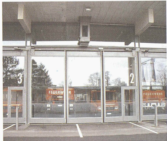
grösste verglaste Falttorflügel Europas

Darf es auch einmal ein schönes Tor sein ?