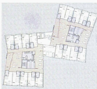
Der Kern mit Nebenräumen trennt das Wohnzimmer vom Essbereich (1. Rang nach der Überarbeitung, Zach + Zünd)

tikon will dieses Altersheim erweitern und veranstaltete einen selektiven Projektwettbewerb, für den sie 12 Architekturteams einlud. 72 neue Plätze in Einzelzimmern waren gefragt, realisierbar in zwei Etappen. Zach + Zünd hatten schon den Wettbewerb gewonnen und konnten auch die Überarbeitungsphase für sich entscheiden. Sie schlagen Häuser im Park vor, die sich dem Bestehenden klar entgegenstellen. Laut Jury verspricht die Erweiterung zu einem exemplarischen Beispiel für das Wohnen im Alter zu werden.