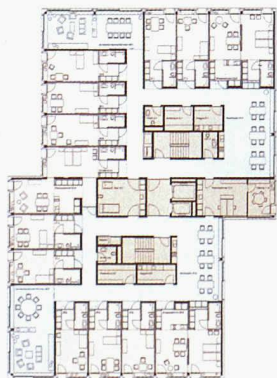
Zwei Wohngruppen je um einen Wohn- und Erschliessungsbereich (2. Rang nach der Überarbeitung, Althammer Hochuli)