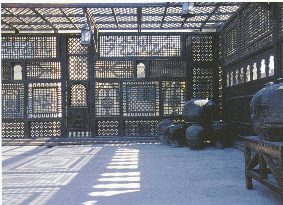
Das kunstvolle Holzgitter (Muscharabya) wirkt wie eine textile Fassade

Rabel Hartmann Schweizer Die Ausstellung im Vitra Design Museum in Berlin dauert bis am 18. Januar 2004. Der Katalog kostet in der Ausstellung 39, im Buchhandel Euro 59,90.