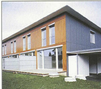
Minergie- und Passivhausbauweise