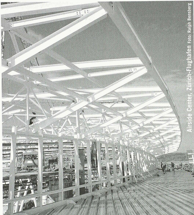
Airside Center, Zürich-Flughafen

Partner für anspruchsvolle Projekte in Stahl und Glas