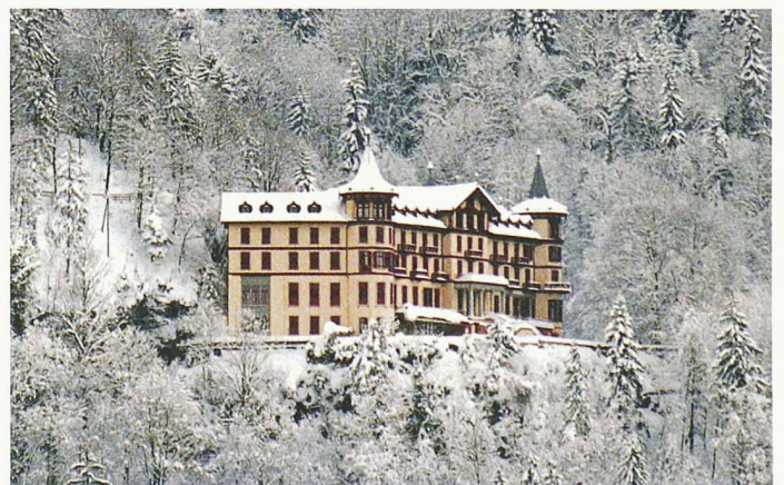
Gäste dank Geschichte: Im originalen Zustand erhaltene Hotels haben heute mehr Erfolg als andere. Das Hotel Giessbach am Brienzensee ist Historisches Hotel des Jahres 2004