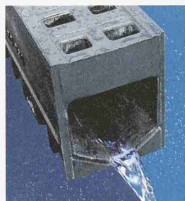
ACO DRAIN Monoblock

ACO DRAIN Monoblockrinnen - Garant für Sicherheit, Stabilität und Funktionalität dank Monogusskonstruktion. Anwendung in allen Bereichen der Entwässerung. Speziell geeignet für den Einbau mit Verbundsteinen oder Kiesbelägen im Garten- und Landschaftsbau. Einfache Reinigung dank Revisionselement. Neueste Produktionsmethoden ermöglichen die Fertigung der Rinnen in einem Stück ohne lose Teile.