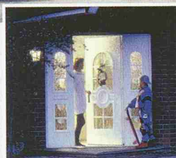
Hörmann Haustüren bieten mehr Sicherheit