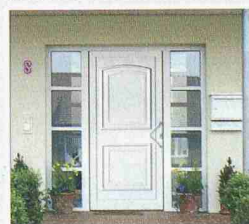
TopComfort Haustüren: über 300 Motive... Sie haben die Wahl!