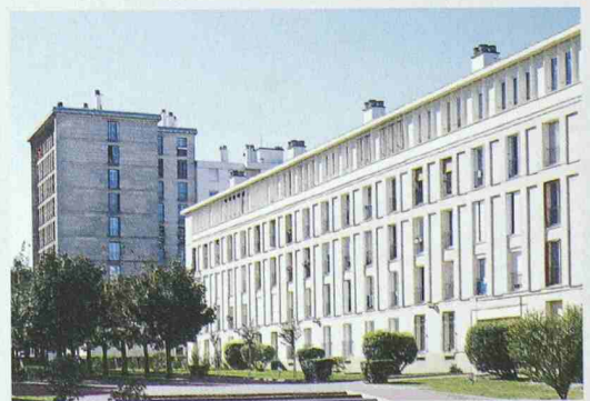
Résidence Victor-Hugo (1955–1957), Pantin, Paris, von Fernand Pouillon